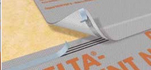
Полная защита от талой воды благодаря дренажным каналам клеящего слоя.