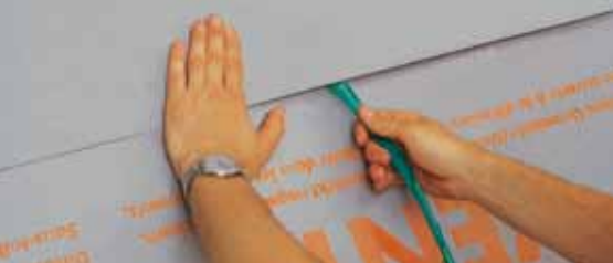
Воздухонепроницаемость благодаря интегрированным лентам