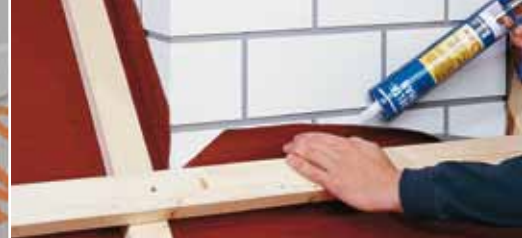
Надёжное примыкание к стенам с помощью клея DELTA®-THAN