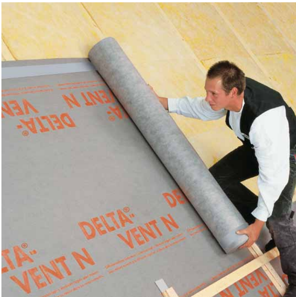
Плёнка DELTA®-VENT N PLUS придаёт мансардной крыше высокую надёжность при разумных затратах.